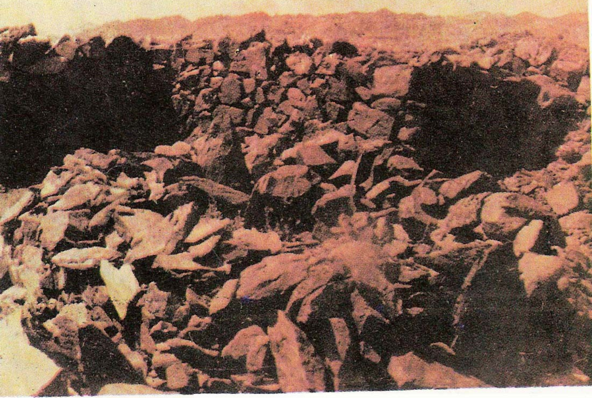
میدان بدر کے قریب ”ابوا“